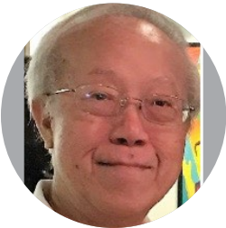
โทมัส ควน

ในช่วงการระบาดของโรคติดเชื้อไวรัสโคโรนา-19 ที่ผ่านมา พิพิธภัณฑ์หลายแห่งได้จัดนิทรรศการเสมือนเพื่อดึงดูดผู้สูงอายุ ความเข้าใจเกี่ยวกับกระบวนการเรียนรู้ของผู้สูงอายุเอเชียทำให้การเรียนรู้นั้นสนุกและได้ผล สารคดีอัตชีวประวัติของผู้ก่อตั้งพิพิธภัณฑ์และศิลปินยอดเยี่ยมมักมีการดูแลเป็นอย่างดี ด้วยจำนวนผู้สูงอายุที่มากขึ้นในปัจจุบัน จึงอาจจำเป็นต้องผนวกเรื่องเล่าที่มีอัตชีวประวัติของผู้สูงอายุ สารคดีไลฟ์สไตล์ชีวิตประจำวันที่มีประโยชน์สำหรับชีวิตลูกหลานในอนาคต การสะสมอัตชีวประวัติของผู้สูงอายุสามารถเป็นฐานข้อมูลสำหรับการเรียนรู้ออนไลน์อย่างไม่เป็นทางการระหว่างพิพิธภัณฑ์และผู้สูงอายุ นอกจากนี้ยังเป็นการแลกเปลี่ยนความรู้ระหว่างพิพิธภัณฑ์ท้องถิ่น และภูมิภาคที่สัมพันธ์กับวัฒนธรรมและชุมชนอีกด้วย